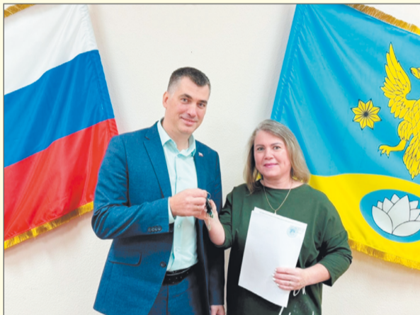
Администрация Колтушского городского поселения

От души поздравляем с этим значимым событием в Вашей жизни и желаем благополучия и процветания в новой квартире!