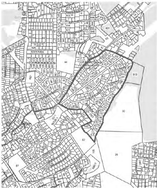
территория СНТ «Коркинские просторы»

Российская Федерация, Ленинградская область, Всеволожский муниципальный район, Колтушское сельское поселение,