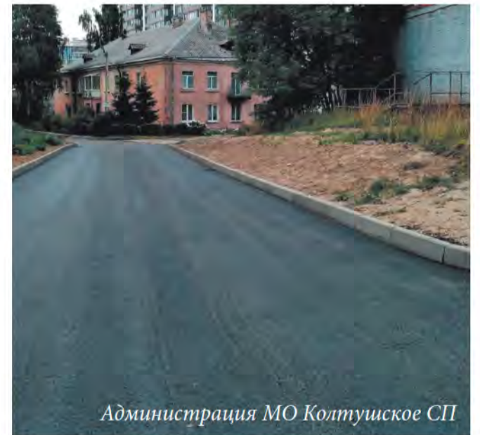
Администрация МО Колтушское СП